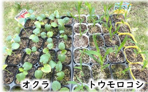
オクラ トウモロコシ

4月中旬、春の陽気の中で種まきレクを行いました。粒が大きめの夏野菜の種を使い、ご入居者の皆さまに土にそっと種を入れていただきました。まいた種はしばらくホーム庭で育て、苗になったらグリーンプラームへ植え替える予定です。「大きくなるのが楽しみだね」と、皆さまの笑顔があふれる時間になりました。